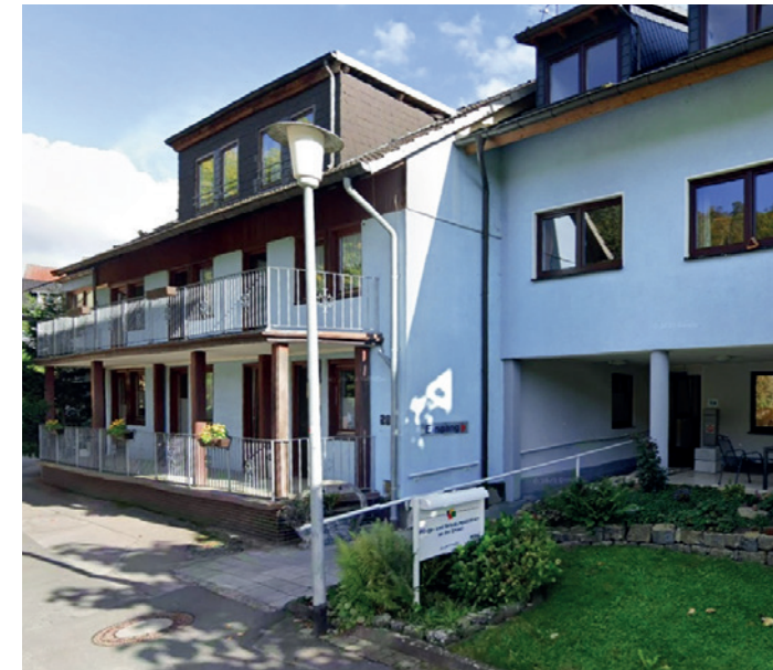
Sozialpsychiatrische vollstationäre Pflegeeinrichtung